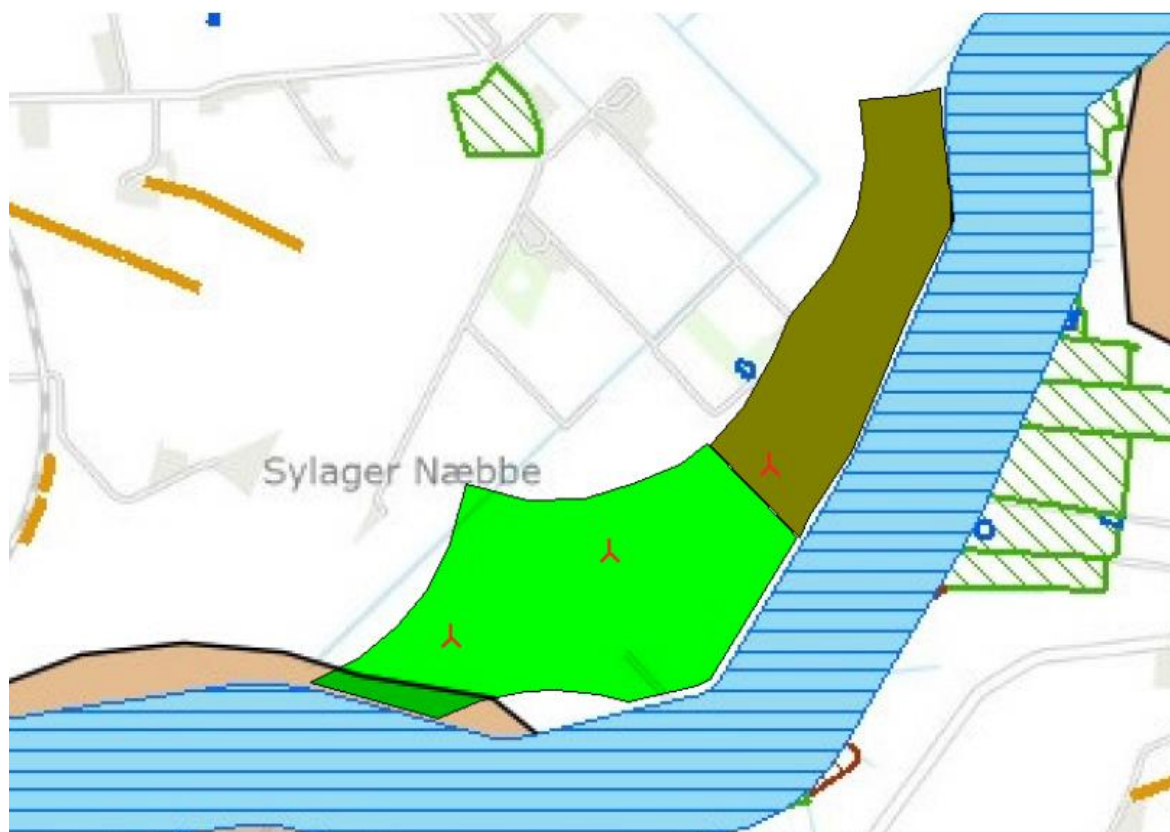
Figur 3 2 vindmøller, kommuneplanens udpegnings til vindmøller, å-beskyttelse.