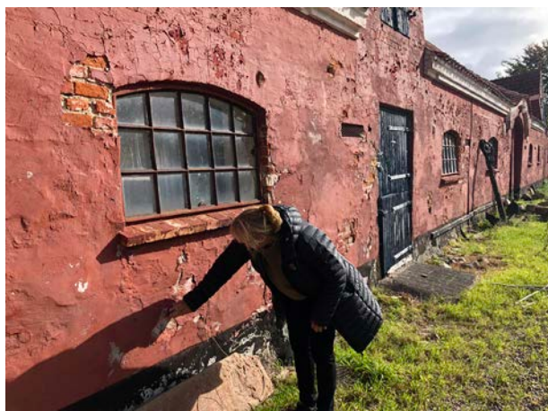
Annebjerggård i Nykøbing, tegnet af arkitekten Einar Andersen i 1923. Bygningen er desværre blevet malet med akrylmaling, og derfor er der sket skader på bygningen