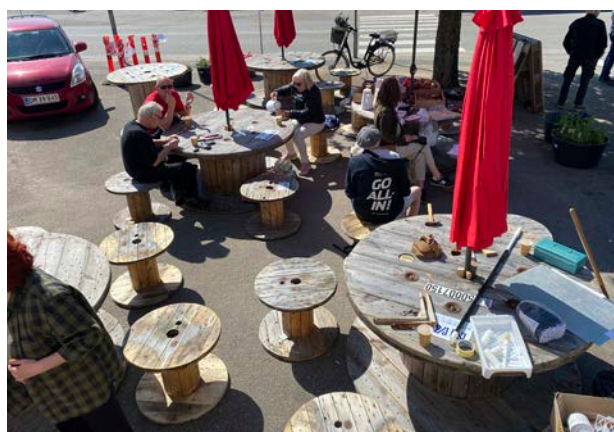
I områdefornyelsesprojektet i Asnæs spiller borgerinddragelse en stor rolle