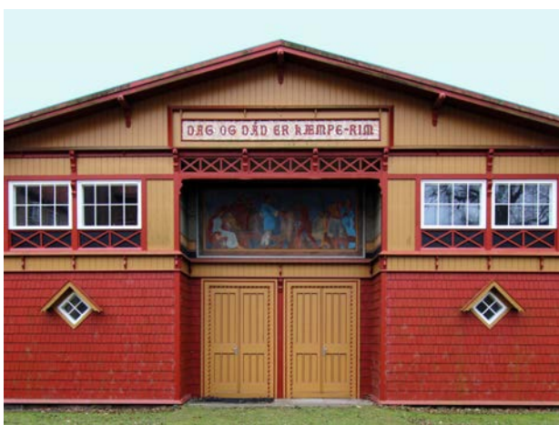
Martin Nyrops øvelseshus i Vallekilde fra 1884. Huset er forsynet med dekorationer og ornamentik muligvis hentet fra vikingerne, for at slå forbindelsen til den oldnordiske fortid