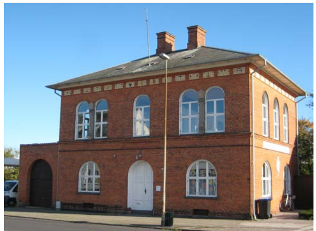
Den Tekniske Skole i Nykøbing anno 2023, en del af Odsherreds kulturarv