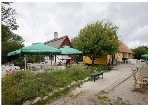
Lodsoldermandsgaarden i Rørvig 1681 er del af den gamle landbys kulturmiljø, som markerer sig med krumme gader og stræder og mange gamle bygninger, hvoraf nogle er flere hundrede år gamle