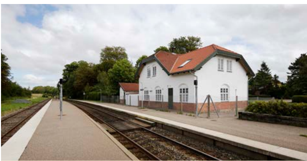
Nationalromantisk stationsbygning i Grevinge fra 1899. En stor del af Odsherredsbanernes bygninger var tegnet af DSB's overarkitekt Heinrich Wenck ligesom stationerne i hovedstaden