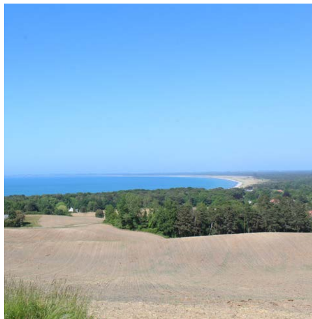
Udsigten over serjøbugten fra Veddingevej

I dette kapitel sætter vi fokus på Odsherreds landskab og miljø. Vi sætter fokus på, hvordan vi skaber arkitektur, som spiller sammen med landskabet, og hvordan vi skal sikre bebyggelse af god arkitektonisk kvalitet i det åbne land og i sommerhusområderne. Samtidig sætter vi fokus på, hvordan byen møder landet, og hvordan vi samtidig tænker på miljøet.