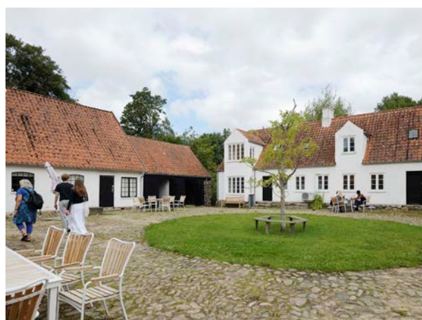
Gårdrum i Museum Malergården i Plejerup