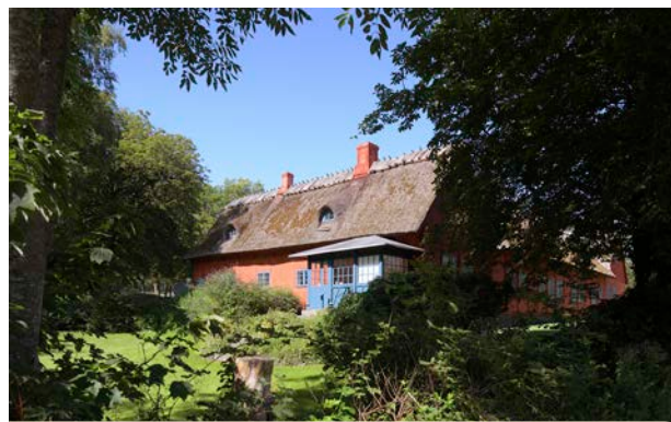
Den røde gård i Vindekilde, som er fredet, er opført med de materialer som var tilgængelige som strå, kalk, ler, træ

Vi skal værne om den historiske fortælling i vores byggede miljø ved at sikre gamle huse mod nedrivning og udslettelse.