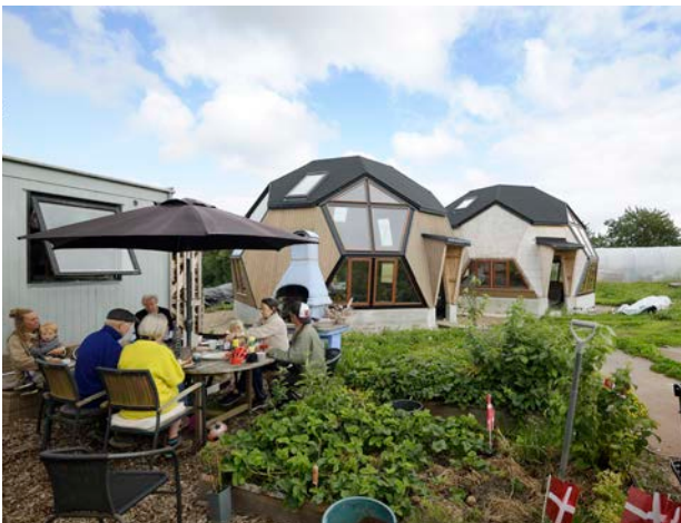
Familien spiser frokost ved siden af deres nybyggede domer i Egeskoven byggefællesskab

tilgængelige for ældre. Det betyder blandt andet, at der skal kigges på om fortovene er gode nok, belægninger er lette at gå på, at der er bænke og toiletter nok, samt steder hvor man kan mødes med andre mennesker. Det er vigtigt at være en del af bylivet – hele livet. Derfor er det også vigtigt at der er nok boliger som er egnede til ældre, og at de er placeret klogt – tæt på indkøb, apotek, læge, bus og tog – så man kan komme rundt at nå det hele på en let og tilgængelig måde.