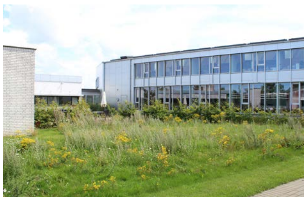
I rådhusets gårdrum klippes kun kanterne af pladsen, hvorefter planterne og blomsterne er kommet op