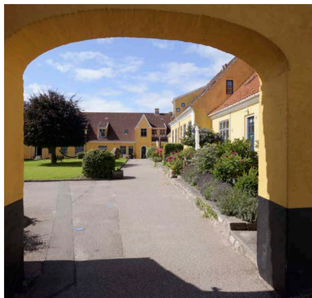
Den gamle bymidt i Nykøbing er ikke SAVE-registeret endnu