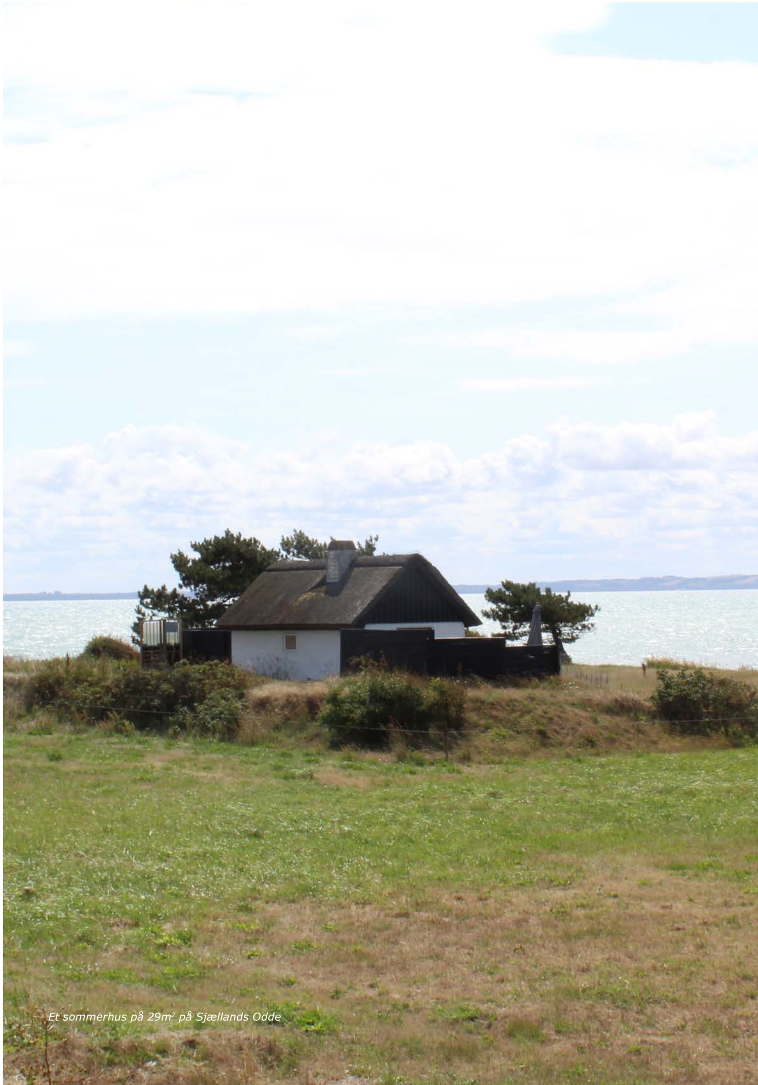
Et sommerhus på 29m 2 på Sjællands Odde