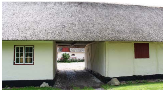
Eksempel på et "ods bindingsværk" - Opført med de materialer som var tilgængelige, som strå, kalk, ler og træ