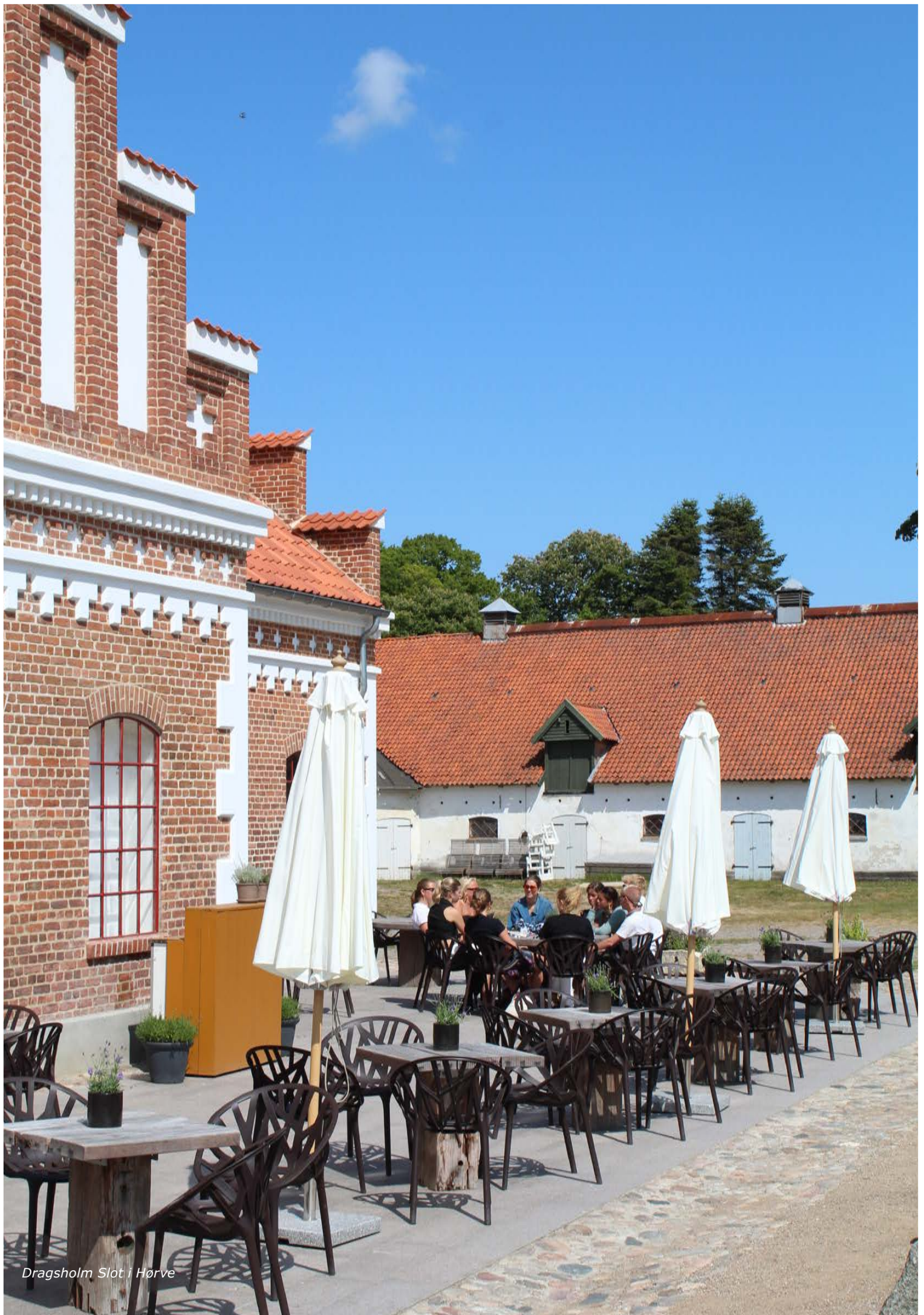
Dragsholm Slot i Hørve