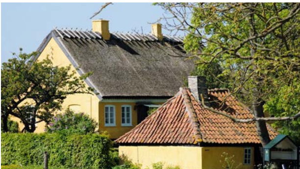
Stråttækt længehus fra 1800 og den gamle smedje i Nakke landsby