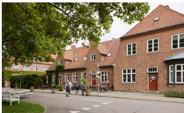
Annebergpark kulturmiljø, i bedre byggeskik stil. Bygninger indenfor området er bevaringsværdigt eller fredet