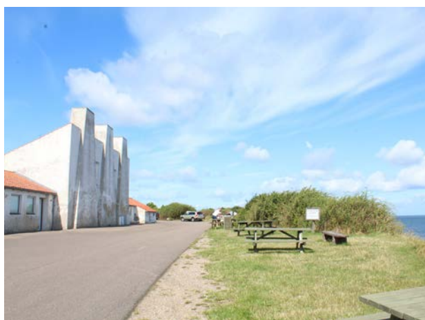
Røgeriet i Havnebyen, tegnet af Arne Jacobsen. Hverken fredet eller SAVE-registeret

SAVE-registreringer er, sammen med bevarende lokalplaner, de værktøjer, som kommunen kan bruge for at sikre at bygninger bliver bevaret og renoveret med respekt for den arkitektoniske historie. Derfor vil vi arbejde målrettet mod at få registrere bevaringsværdige bygninger, så vi sammen kan passe på vores historie og identitet.