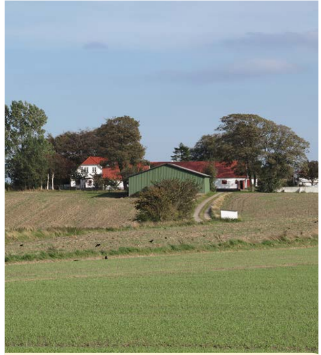
Landbrugsbygning placeret på tværs af vejen så den fylder mindre i landskabet