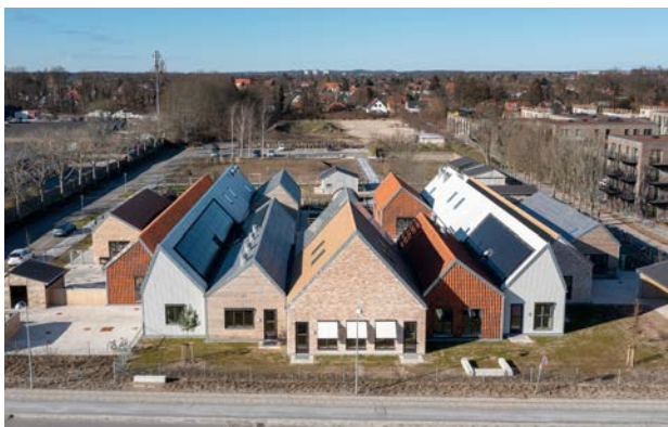
En cirkulær bygning, bygget med materialer fra en nedrivning på samme sted. Bygherre Gladsaxe Kommune