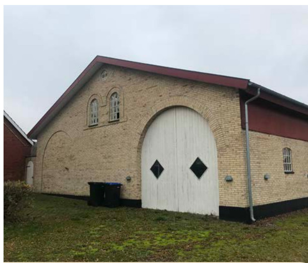
På Stålhøjvej i Asnæs har bygherren besluttet at beholde den gamle gård fra 1900-1923 og lave det om til 17 moderne lejligheder. Det betyder, at vi både sparer på jordens ressourcer, men også at områdets kulturhistorie bliver bevaret