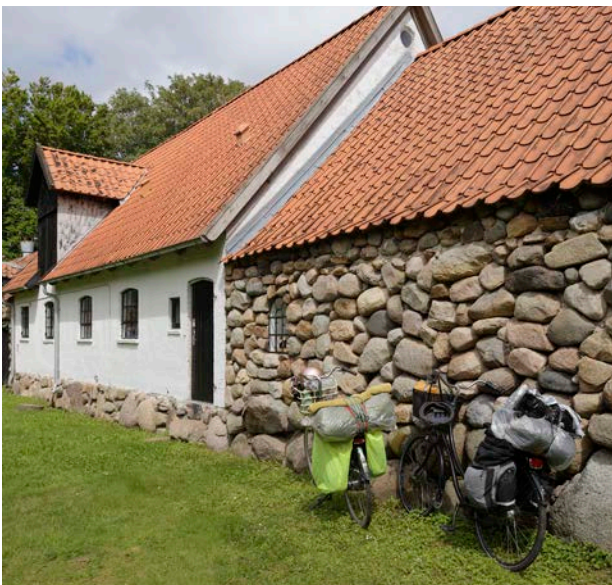
Det skal være nemmere at cykle og gå en tur i stedet for at tage bilen

Derfor skal trafikken måske tænkes anderledes, fx med ensretninger eller flere gågader.