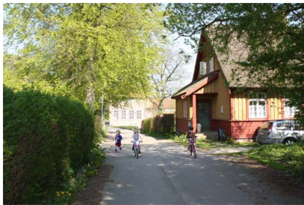
Kulturmiljø i Vallekilde, med mange bevaringsværdige bygninger og smukke gamle træer

For at bevare den historiske fortælling i et område, som også er med til at skabe stædernes særlige identitet, skal nybyggeri respektere de historiske miljøer og tilstræbe at indpasse sig til området. Det betyder ikke, at det skal være en kopi af den eksisterende bebyggelse, det kan også være en detalje, farve eller form, som tages med i den nye bebyggelse.