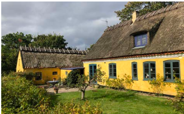
Et bevaringsværdigt længehus fra 1800 i Nakke, optaget i en bevarende lokalplan for Nakke landsby