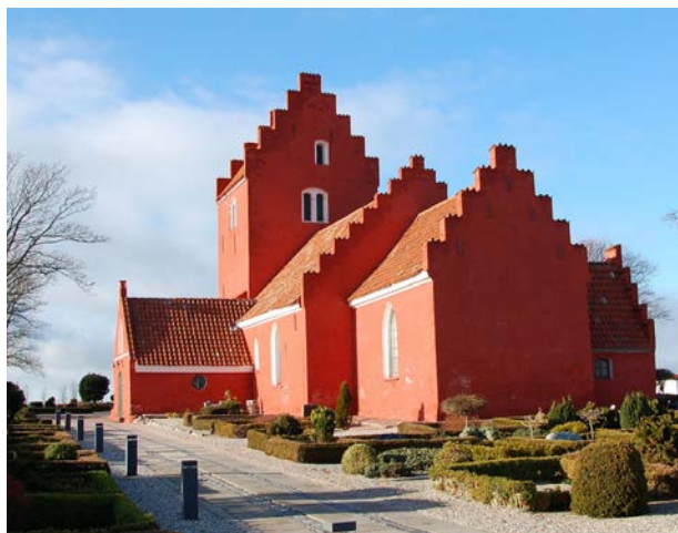
Den røde kirke på Sjællands Odde fra omkring 1300 fremstår stadig smukt med en kalket overflade