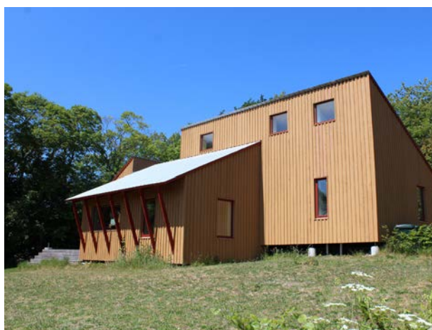
Dette hus er tilpasset omgivelserne i Vallekilde ved at bruge de samme materialer og farver, som forskellige bygninger i området, blandt andet øvelseshuset på billedet til venstre. Arkitekt Arcgency, opført i 2020