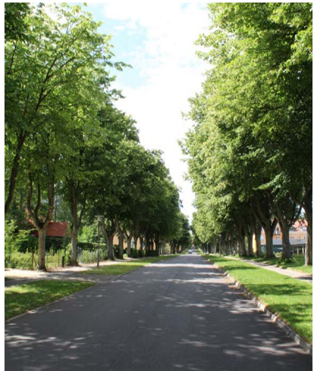
Linde allé og Annebergparken i Nykøbing med karakteristisk beplantning